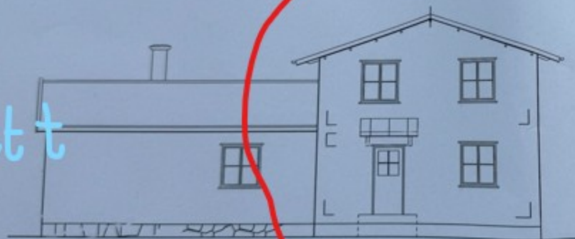
FASAD MOT ÖST