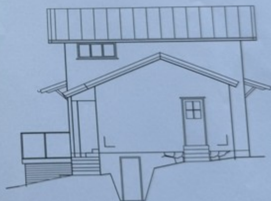
FASAD MOT SYD