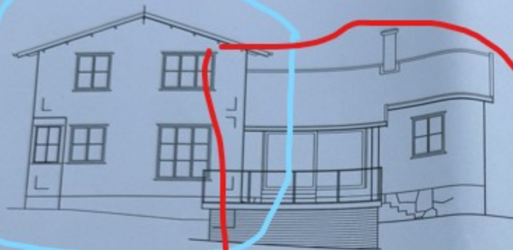
FASAD MOT VÄST